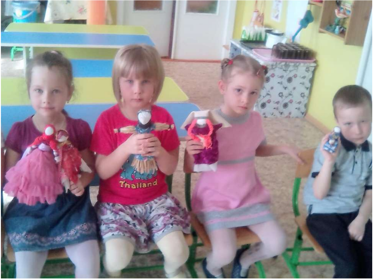
куклы для игры в театр